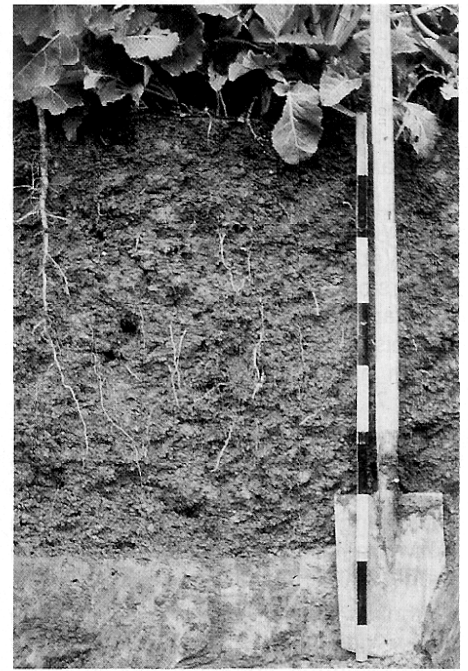
Abb. 7: Das Kornstück des Ahrweiler Verfahrens ist eine Gefügeveränderung des dichten Unterbodens. Nach einer mechanischen Intensivauflöckerung entsteht durch Zerfall der dichten Aggregate ein lockeres, belüftetes, leicht durchwurzelbares und speicherfähiges Bodengefüge.