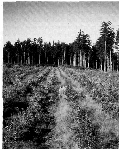
Abb. 5 (links): Konventionell - ohne Bodensanierung. Eine Vielzahl von Pflanzen ist von der bodenständigen Flora erdrückt worden. Nur im Hintergrund sind einige Pflanzenreihen erkennbar.