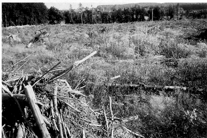
Abb. 1: Die Wiederaufforstungen meliorationsbedürftiger Flächen werden durch die Konkurrenz der bodenständigen Flora immer schwieriger. Z.T. gehen die mehrmals nachgebesserten Kulturen restlos unter.

Das Vorhaben, die Waldschäden einzudämmen und einen gesunden Wald aufzubauen, kann nur dann gelingen, wenn die betroffenen Standorte, flankierend zu