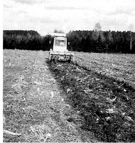
Abb. 3 (links): Die Kronfräse, fachgerecht eingesetzt, erfüllt die Forderungen, die an die Melioration der Humusaufgabe gestellt werden, in idealer Weise. In vielen Fällen ist sie Wegbereiter für das Ahrweiler Meliorationsverfahren.